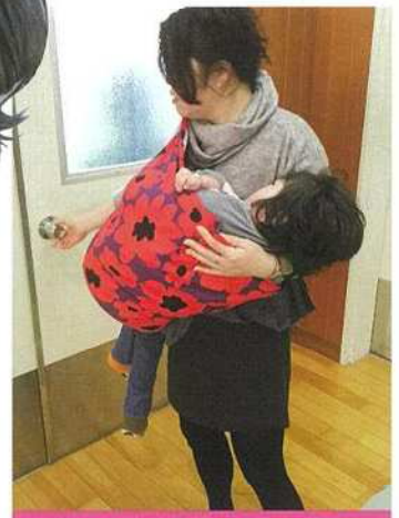
抱っこして片手でドアOpen！