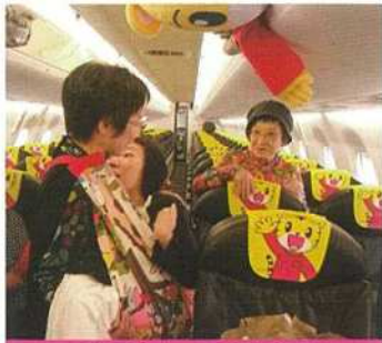
飛行機内への移動も！