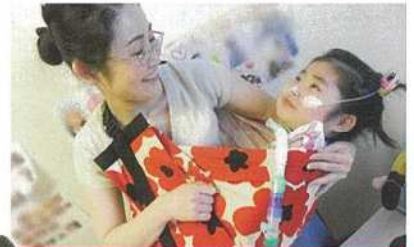
呼吸器っ子も抱っこで笑顔♪